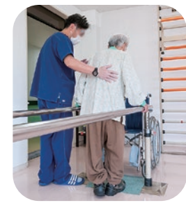
リハビリテーション 9:00～12:00 13:00～16:00