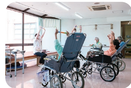
レクリエーション 10:00～10:50 15:00～15:50