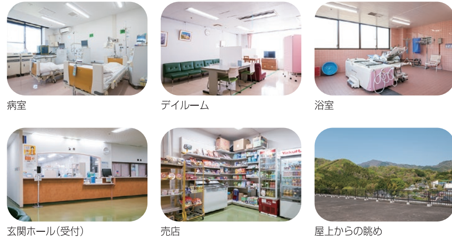
病室 デイルーム 浴室 玄関ホール(受付) 売店 屋上からの眺め

病室は明るい日差しが差し込む4人部屋が基本となっております。屋上からは大山をはじめとする、美しい山々が眺められます。