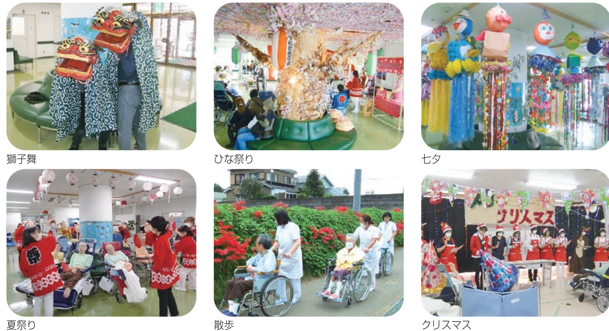
獅子舞 ひな祭り 七夕 夏祭り 散歩 クリスマス

入院患者様にメリハリのある日々を過ごしていただけるよう、季節ごとにイベントの企画や運営を行っております。ボランティアによる訪問イベントや映画鑑賞、近隣の中学・高校生による吹奏楽や合唱、各サークル団体によるフラダンスやハーモニカ演奏の披露など、楽しいイベントを企画しています。