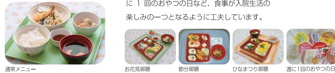
通常メニュー お花見御膳 節分御膳 ひなまつり御膳 週に1回のおやつの日

四季折々を感じていただけるようなメニューを管理栄養士が考え、地元の新鮮な野菜や食材を使用して手作りしています。また、イベントメニューやお誕生日のケーキ、週に1回のおやつの日など、食事が入院生活の楽しみの一つとなるように工夫しています。